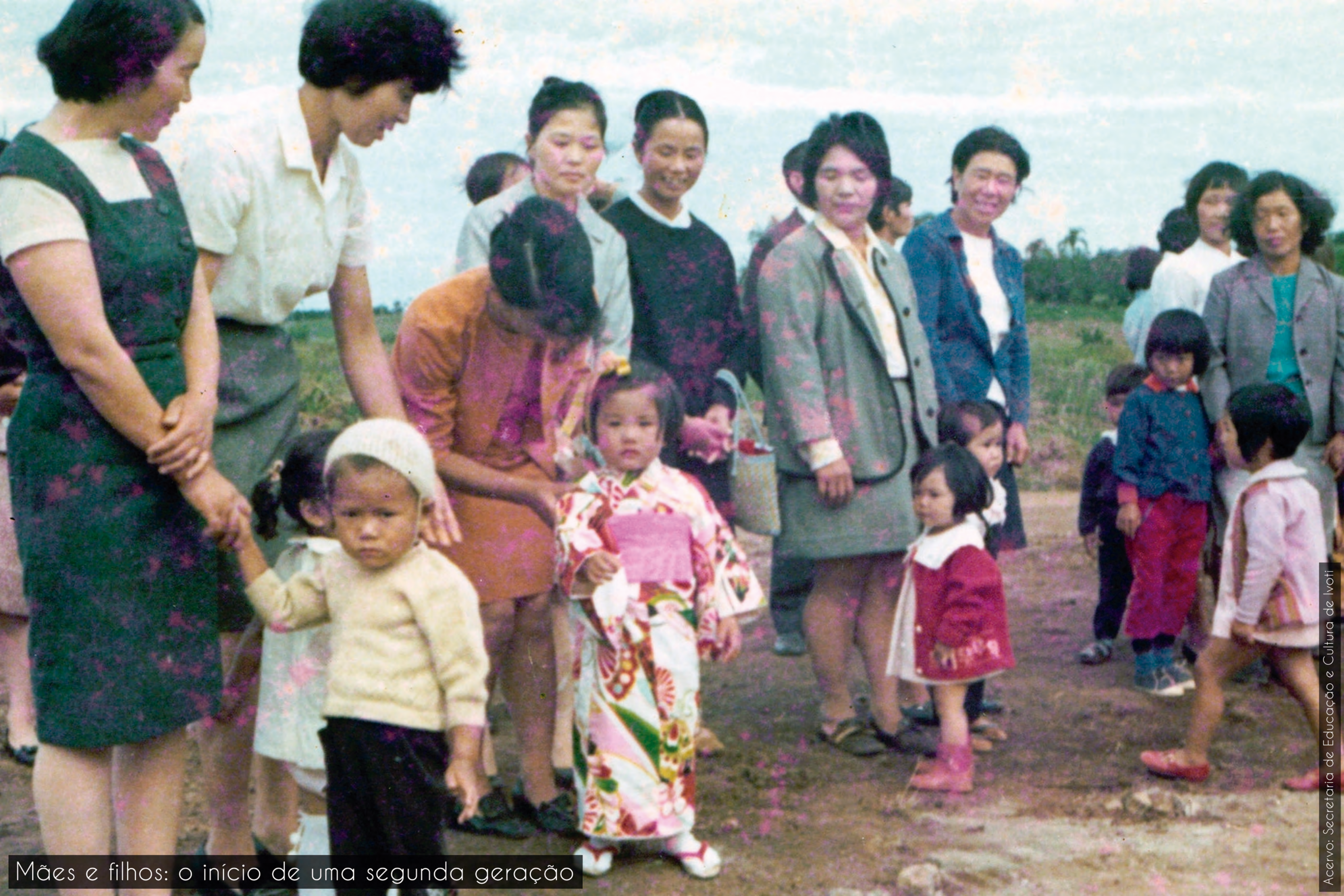
Mães e filhos: o início de uma segunda geração