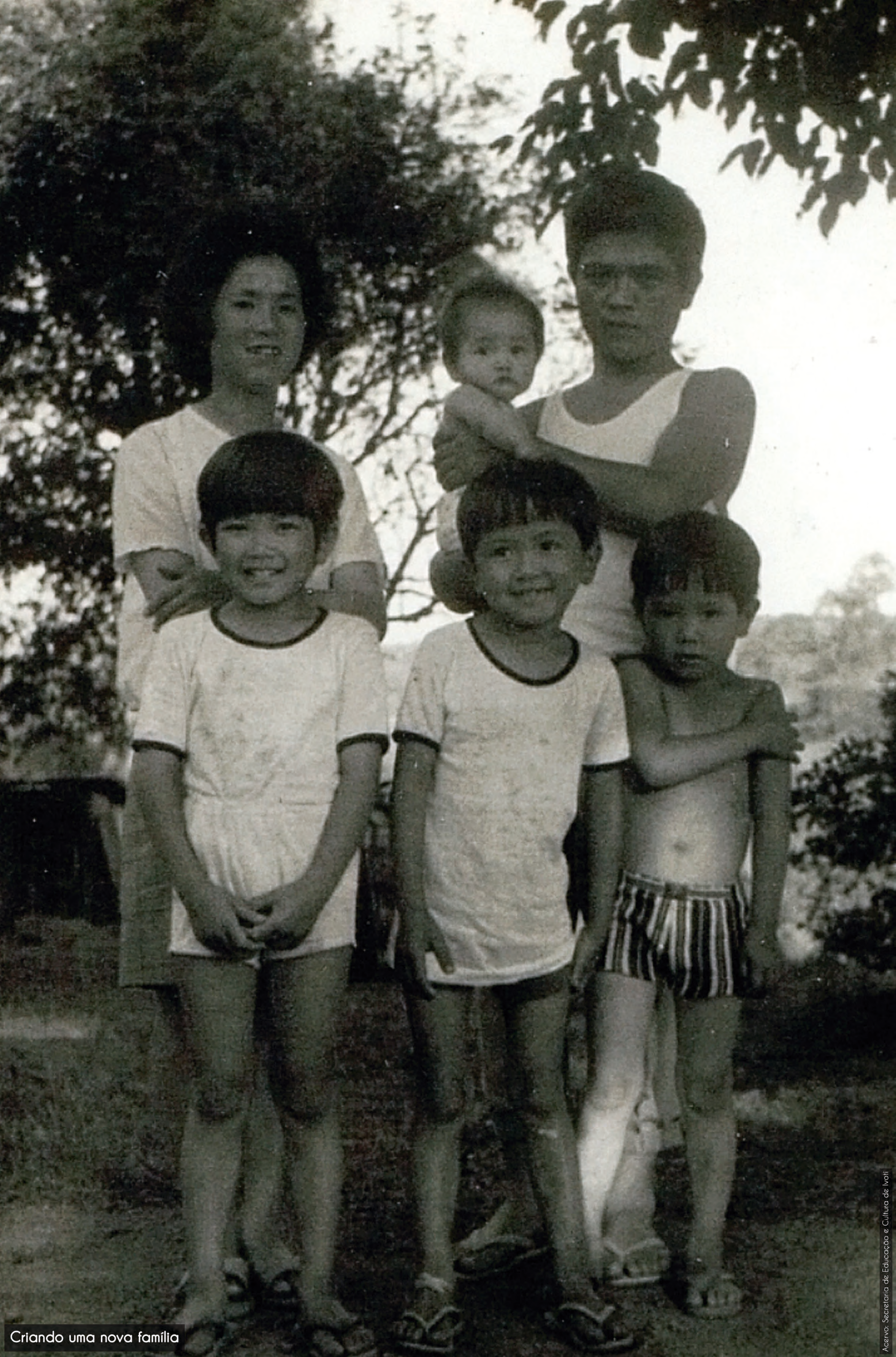
Criando uma nova família