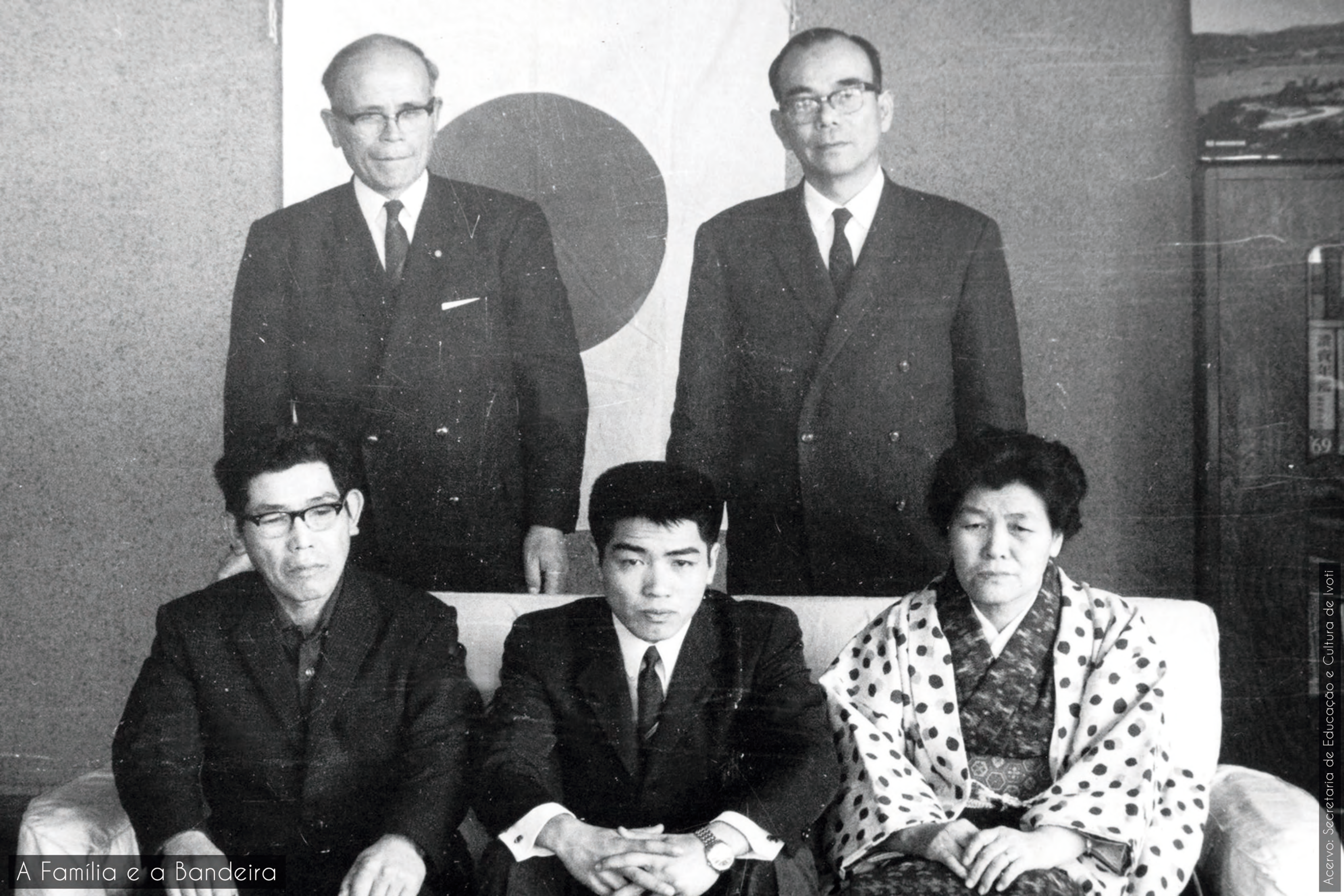
A Família e a Bandeira