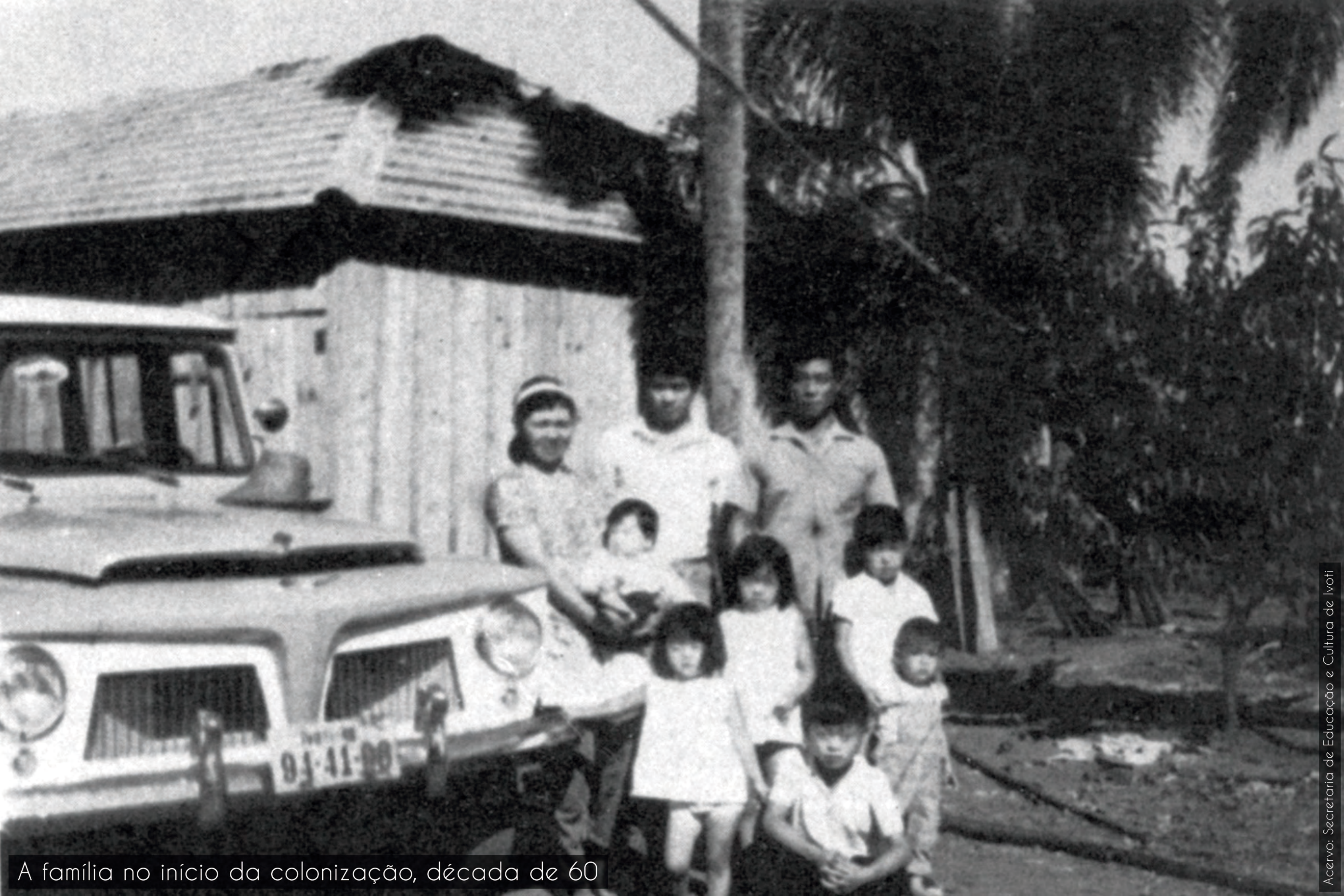
A família no início da colonização, década de 60