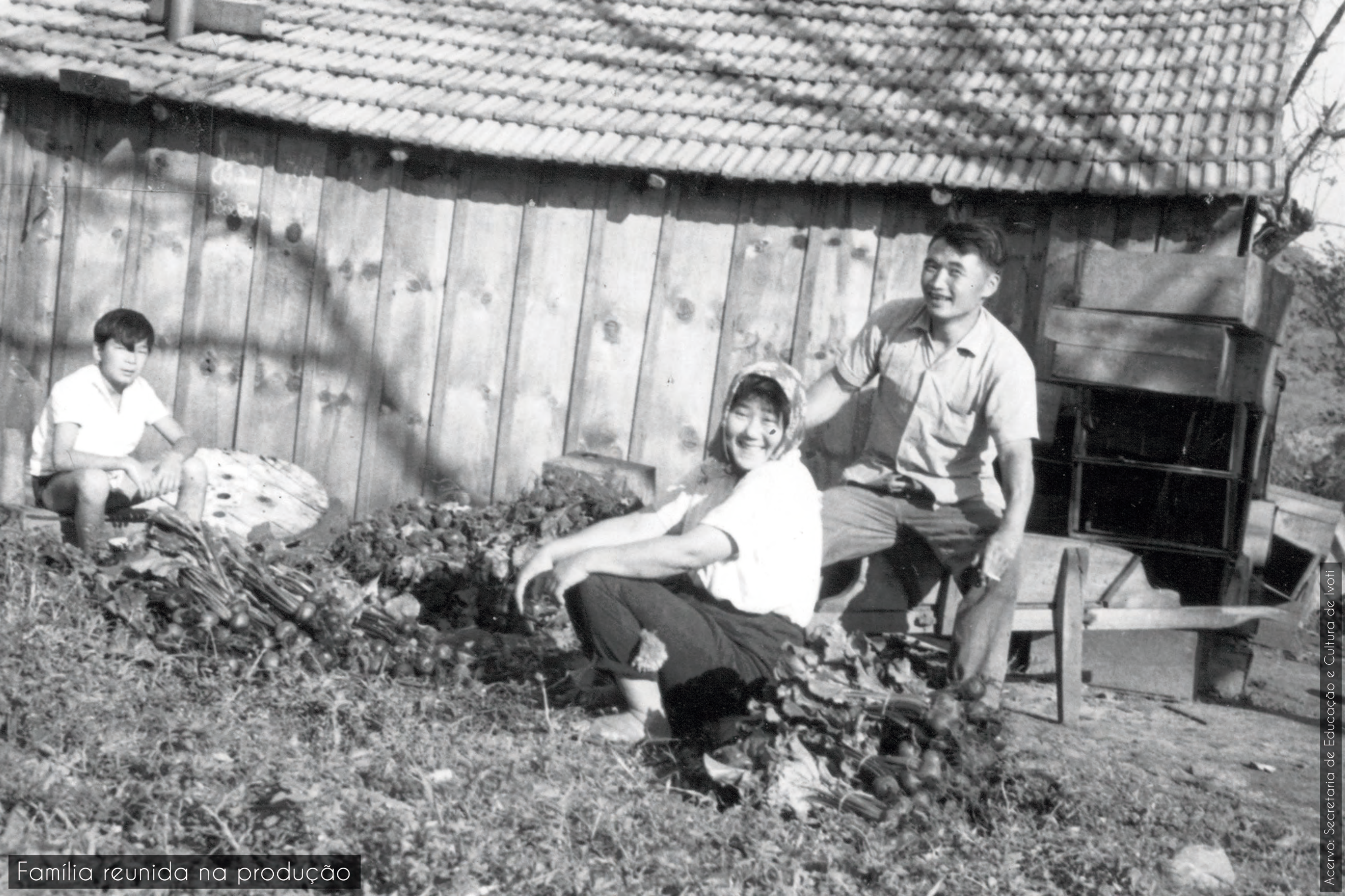
Família reunida na produção