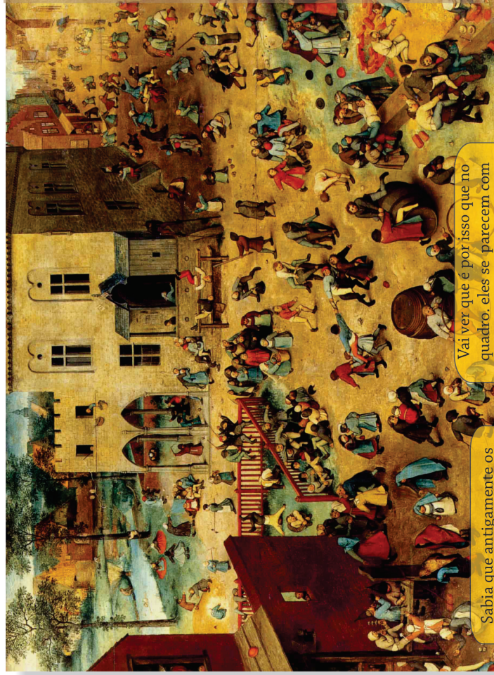
Jogos Infantis – Pieter Bruegel (118 x 161 cm; 1560). Kunsthistorisches Museum, Viena.

Vai ver que é por isso que no quadro, eles se parecem com adultos. E olha quantas brincadeiras! Mas, e as crianças?