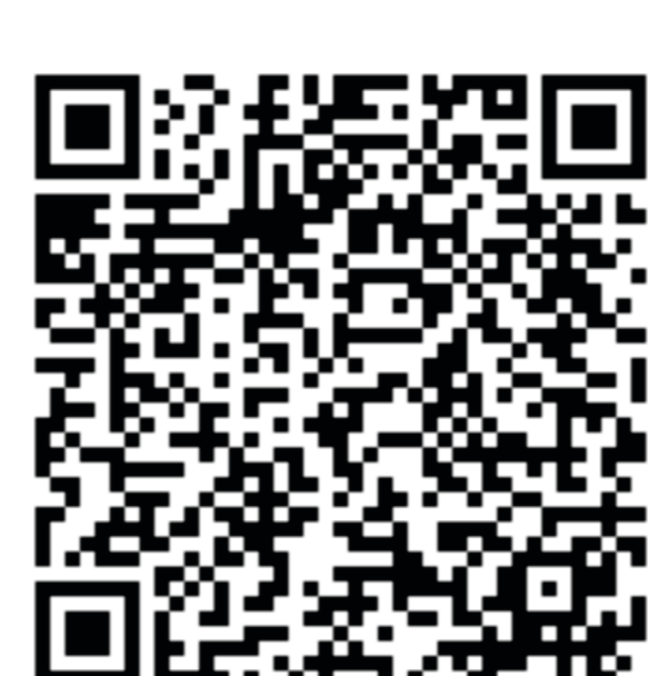
Lei nº 9.716