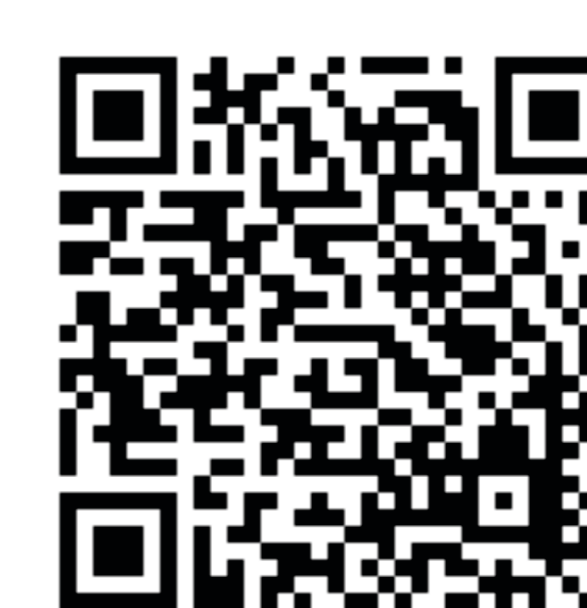
Lei nº 10.216