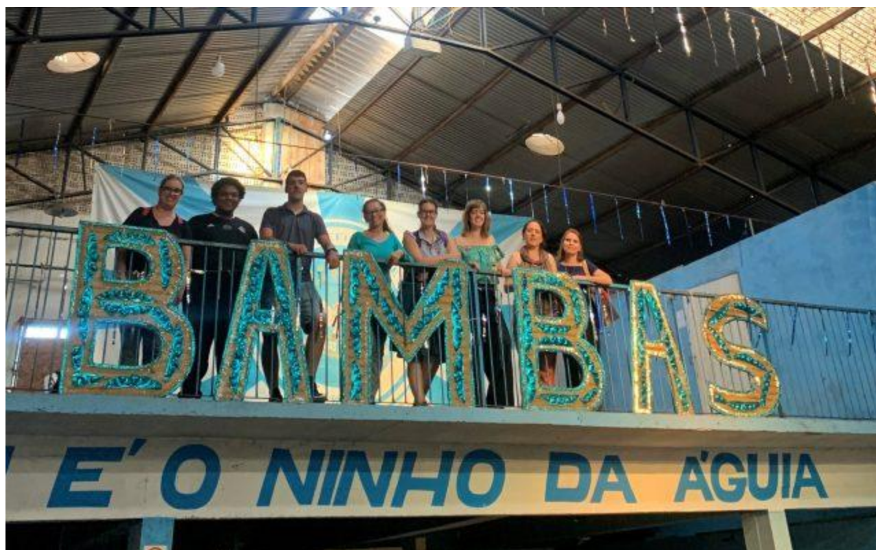
Alunos curadores na quadra dos Bambas

By Jornal da Capital - 17 de julho de 2023