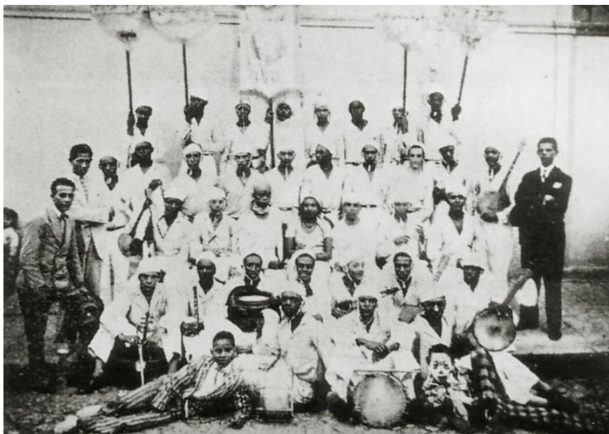
Bloco carnavalesco Os Turunas em 1931

https://pt.wikipedia.org/wiki/Rio_Branco_%28Porto_Alegre%29